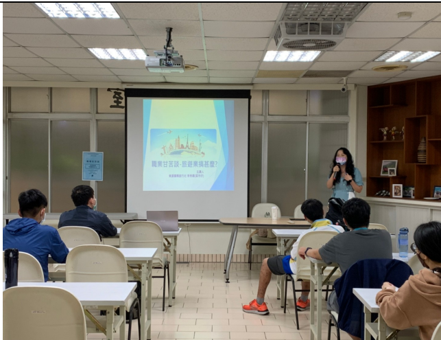
說明：旅遊業甘苦談