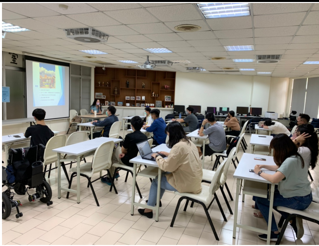
說明：旅遊業甘苦談