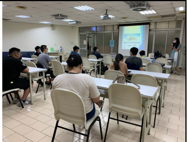
說明：旅遊業甘苦談