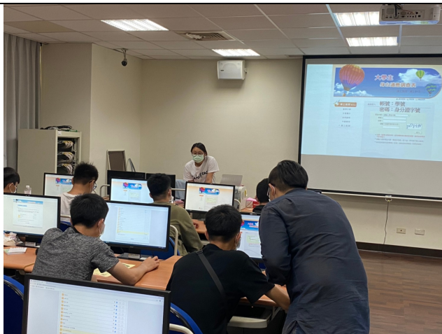
說明：個別指導測驗登入