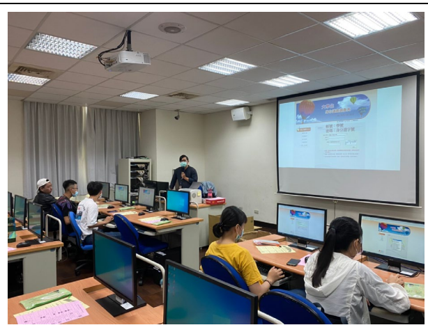
說明：學生聆聽登入測驗方式