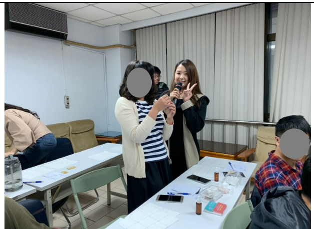
說明：精油競賽頒獎