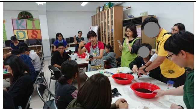
說明：老師說明草頭娃娃