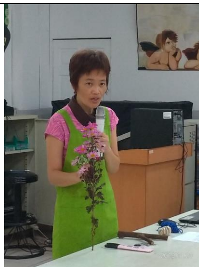
說明：老師說明花與花語