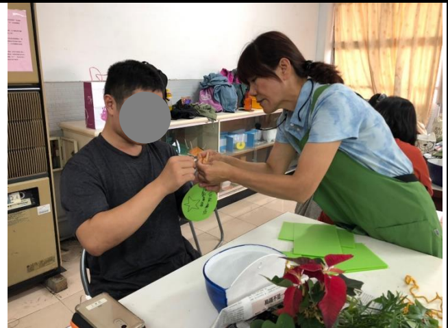
說明：老師協助成員製作盆栽