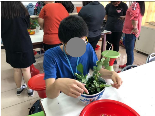
說明：成員完成的盆栽