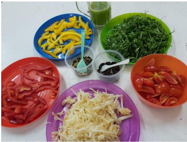
說明：五行五色蔬果捲材料