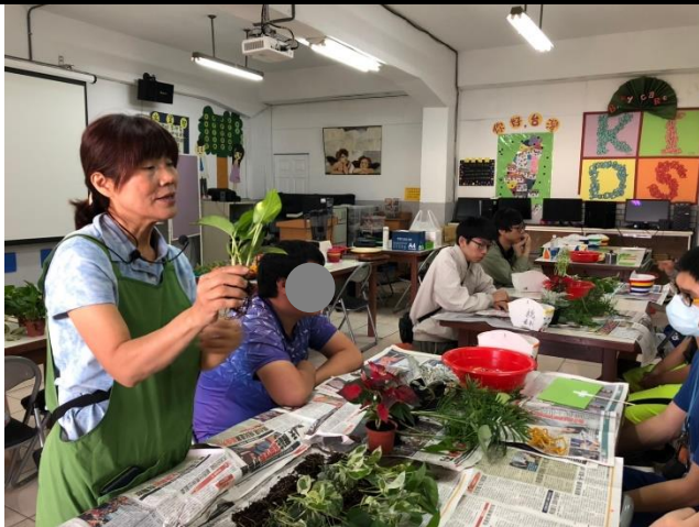
說明：老師講解組合盆栽的植物