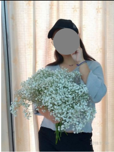
說明：成員喜歡的花