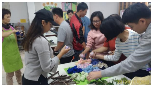
說明：選自己喜歡的材料