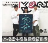
本校學生獲得德國紅點獎