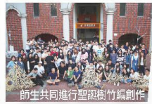
師生共同進行聖誕劇竹編創作