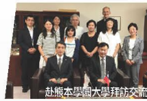
赴熊本學國大學拜訪交流

全球300所姐妹校，有來自30多個國家的國際學生就讀。學生可申請學海築夢、學海飛颺及學海借珠等計畫赴海外姐妹校研習，並前往美國、日韓、奧地利、法國、德國等海外企業實習。全球海外實習「學海築夢計畫」，補助金額私立科大最高。