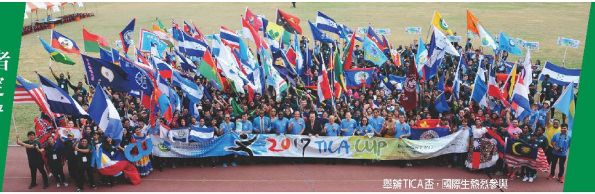
舉辦TICA盃，國際生熱烈參與